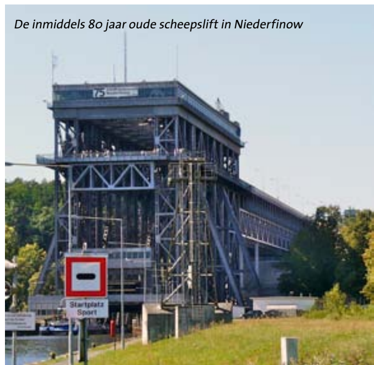
De inmiddels 80 jaar oude scheepslift in Niederfinow

We ontdekten ook grote tabaksplantages, iets wat ons eigenlijk zeer verraste. Hier en daar wat industrie (nieuw en oud) en kleine, aantrekkelijke dorpjes. Onze bestemming die dag was Schwedt, dat we na vier uur varen bereikten. In Schwedt waren zowel een kleine watersporthaven (voor ons te ondiep) als een grotere haven, die ons een zeer fraaie ligplaats bood. De keuze was gemakkelijk. Ook deze haven was een verrassing. Alles zag er bijzonder verzorgd uit, de toiletten waren superschoon en de douches op een speelse manier gebouwd. Ook was er nog een bistro, met een zeer aardige uitbaatster, die van alle markten thuis was. Ze werkte niet alleen in de bediening, maar was ook verantwoordelijk voor de caravanstalling en de haven, verkoop van douchemunten, enz. Ze was altijd druk bezig, maar ook altijd even vrolijk en behulpzaam. Het gebruikelijke en informatieve 'hapje en drankje' op de steiger met andere Oderbevarende schippers bezorgde ons een aantal nuttige tips voor onze verdere reis. Helaas kon niemand ons aan de Poolse vlag als gastenvlag helpen.