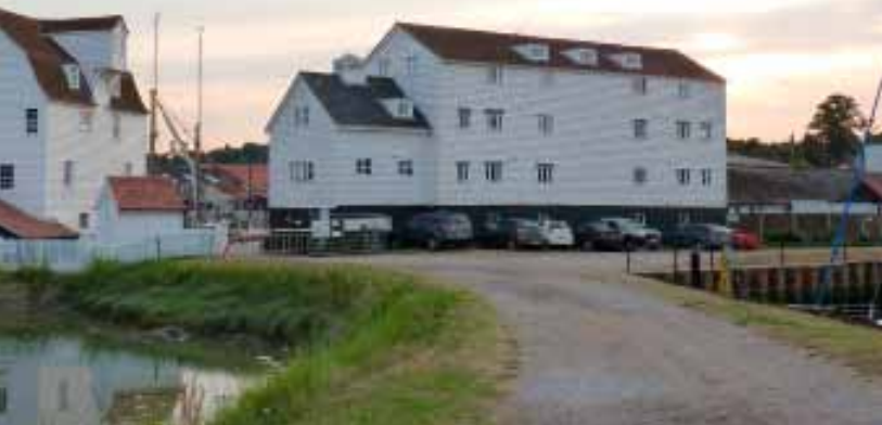
Tide Mill Woodbridge

door het aanspoelen en afkalven van grind en zand met de golven. Het nabijgelegen stadje Orford had vroeger waarschijnlijk zicht op zee. In dit prachtige gebied gaan we voor anker! Met onze bijboten bezoeken we Orford.