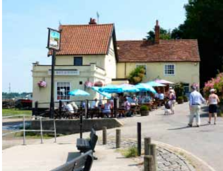
Pin Mill - The Butt &amp; Oyster pub

vaartschepen. Pin Mill heeft veel kleine industrie (zeilmakerij, mouterij, steenbakkerij), maar is nu vooral bekend door The Butt & Oyster Pub en het jacht- en dinghyzeilen. Op deze mooie plek genieten we van een heerlijke lunch. Dan is het weer tijd om naar de schepen terug te keren. We varen onder de Orwell Bridge door, de eerste en enige brug van deze toertocht. Het is nog een half uurtje varen naar de sluis van Ipswich, de hoofdstad van het graafschap Suffolk. Ipswich is één van de oudste Engelse steden (7 e - 8 e eeuw) en belangrijk voor de Noordzeehandel. Het moderne Ipswich heeft een nog steeds werkende havenpoort die goed is voor meerdere miljoenen ton vracht per jaar. Onlangs heeft de stad voornamelijk langs de waterkant een uitgebreide verbouwing ondergaan, en het is nu een residentieel en commercieel centrum. Hier zijn ook de twee jachthavens Ipswich Dock en Neptune Marina gevestigd. Neptune Marina heet ons van harte welkom! Voor ieder schip is er een op naam gereserveerd plekje in de haven.